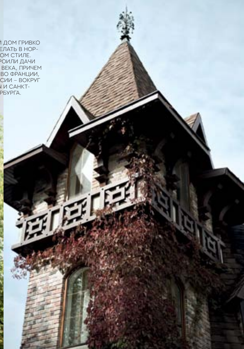
УСАДЕБНЫЙ ДОМ ГРИВКО РЕШИЛ СДЕЛАТЬ В НОРМАНДСКОМ СТИЛЕ. В НЕМ СТРОИЛИ ДАЧИ В КОНЦЕ XIX ВЕКА, ПРИЧЕМ НЕ ТОЛЬКО ВО ФРАНЦИИ, НО И В РОССИИ – ВОКРУГ МОСКВЫ И САНКТ-ПЕТЕРБУРГА.

В ы едете из Москвы по рижской трассе: чем дальше от столицы, тем пейзаж становится все унылее и однообразнее. Ельник, редкие деревни с покосившимися избами. Приезжаете в город Пустошка, куда последние пару лет даже поезд не ходил, потом, правда, возобновили. Вот и деревенька Ореховно — на первый взгляд, ничем не отличающаяся от других. Опрятные ворота.