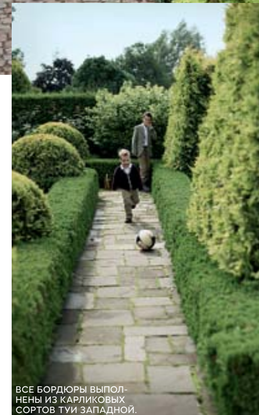
ВСЕ БОРДЮРЫ ВЫПОЛНЕНЫ ИЗ КАРЛИКОВЫХ СОРТОВ ТУИ ЗАПАДНОЙ.